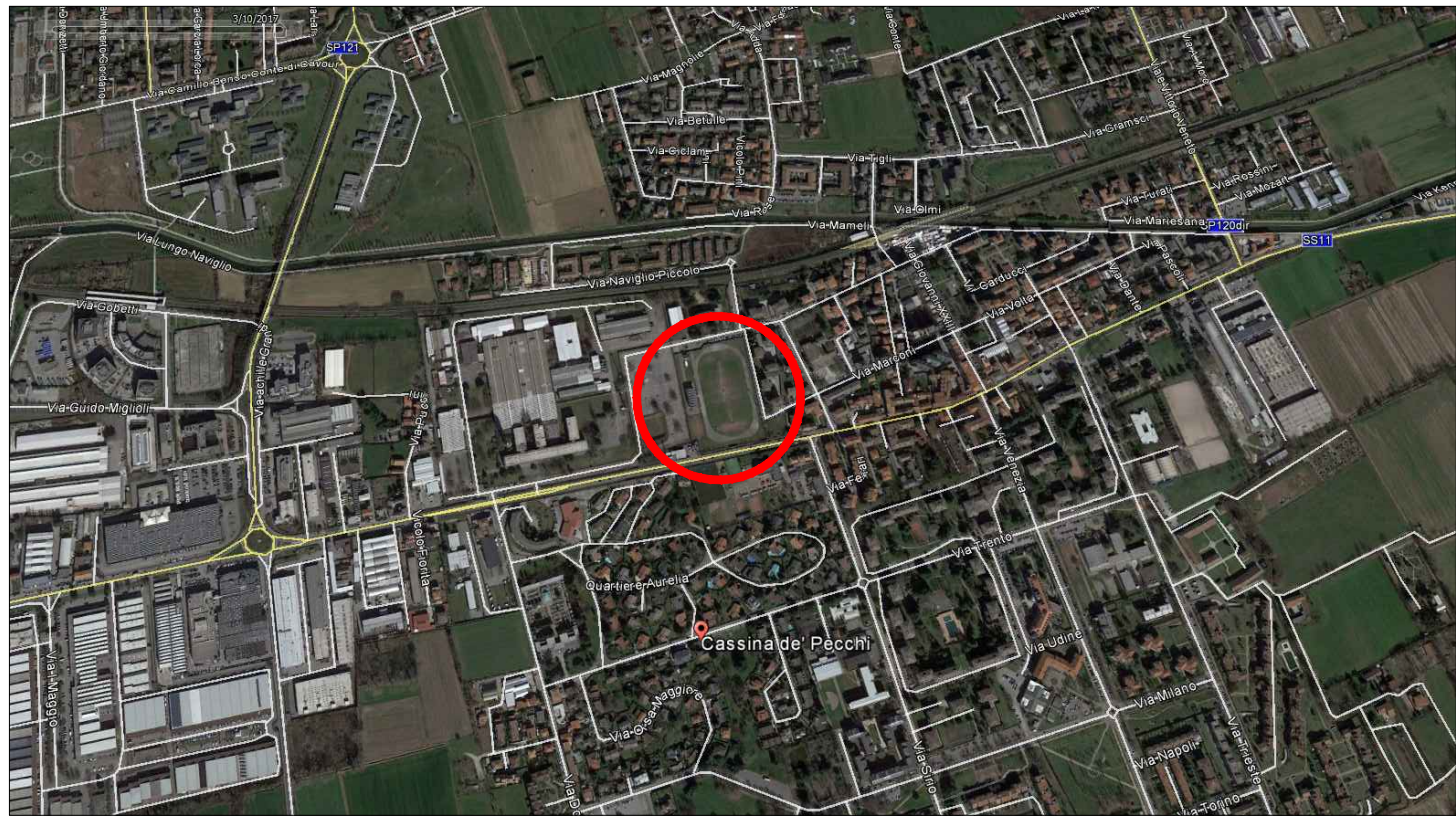
1 INQUADRAMENTO TERRITORIALE ORTOFOTO